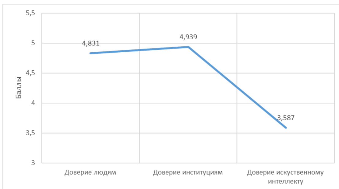
Рис. 1. Доверие студентов людям, институциям и ИИ.

институциям. Сравнение средних показателей с помощью дисперсионного анализа (однофакторная ANOVA) выявило статистически достоверные различия между ними ( F = 52,79 ; p < 0,001 ). Согласно рисунку 1, доверие студентов по отношению к ИИ существенно ниже их доверия к людям и институциям ( t = 8,989 ; d = 0,808 ; p_{\text{bonf}} < 0,001 и t = 9,613 ; d = 0,878 ; p_{\text{bonf}} < 0,001 соответственно).