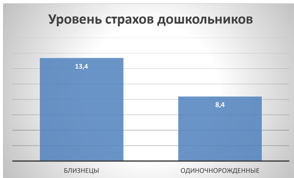
Рис. 1. Сравнительный анализ уровня страхов у близнецов и одиночно рожденных дошкольников

Близнецы достоверно имеют большее количество страхов, чем одиночно рожденные дошкольники. Близнецы боятся в одиночестве, боятся, когда их разделяют с братом или сестрой. Беседы с воспитателями показали, что монозиготные близнецы никогда не ходят в сад по отдельности, даже если один из детей здоров. Набор страхов в трех парах монозиготных близнецов оказался идентичным.