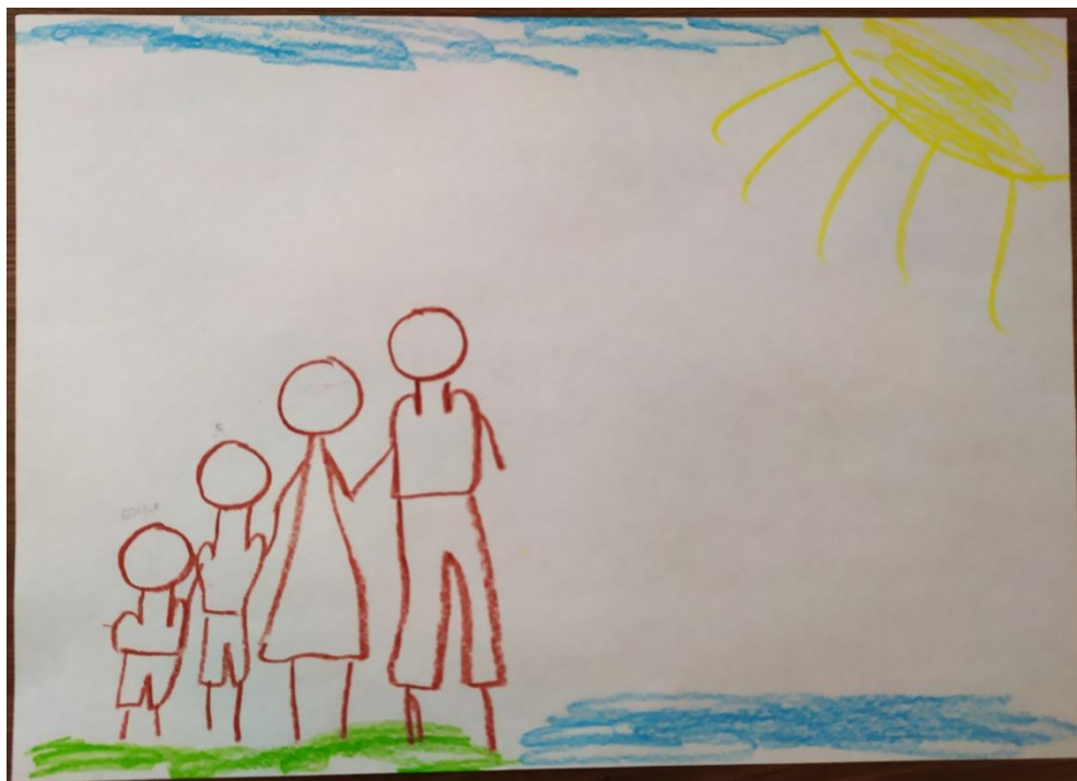
Рис. 3. Рисунок семьи Софии

Особый интерес представляет анализ результатов методики «Рисунок семьи». Изображая свою семью, один ребенок из пары игнорирует наличие сиблинга и рисует только родителей и самого себя. При этом такой ребенок открыто проявляет негативное отношение к своему брату/сестре, демонстрирует некоторую конкуренцию, стремление превосходить второго близнеца, доказать ему свое совершенство в какой-либо деятельности. Для наглядности ниже представлены рисунки некоторых пар (рис. 3, 4).