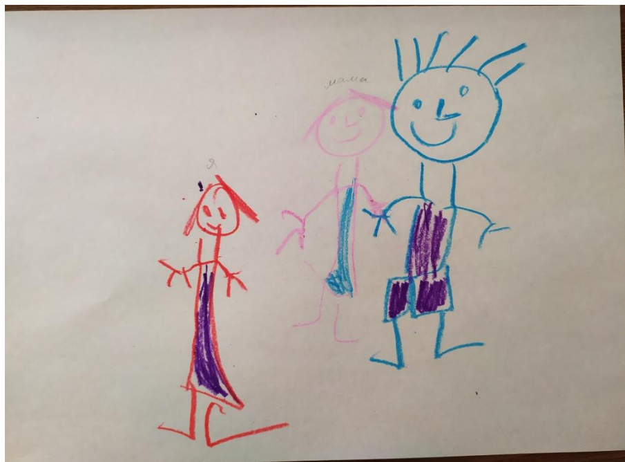
Рис.4. Рисунок семьи Марии. Справа налево: папа, мама, Мария (второй близнец, София, отсутствует в рисунке).