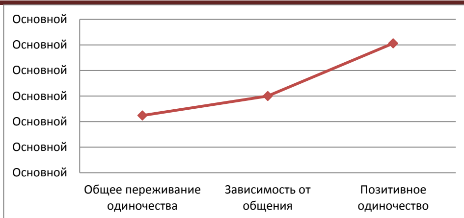
Рис. 2. Распределение параметров переживания одиночества в группе мальчиков-подростков 15 лет.

Сравним переживание одиночества девочками и мальчиками-подростками в возрасте 15 лет.