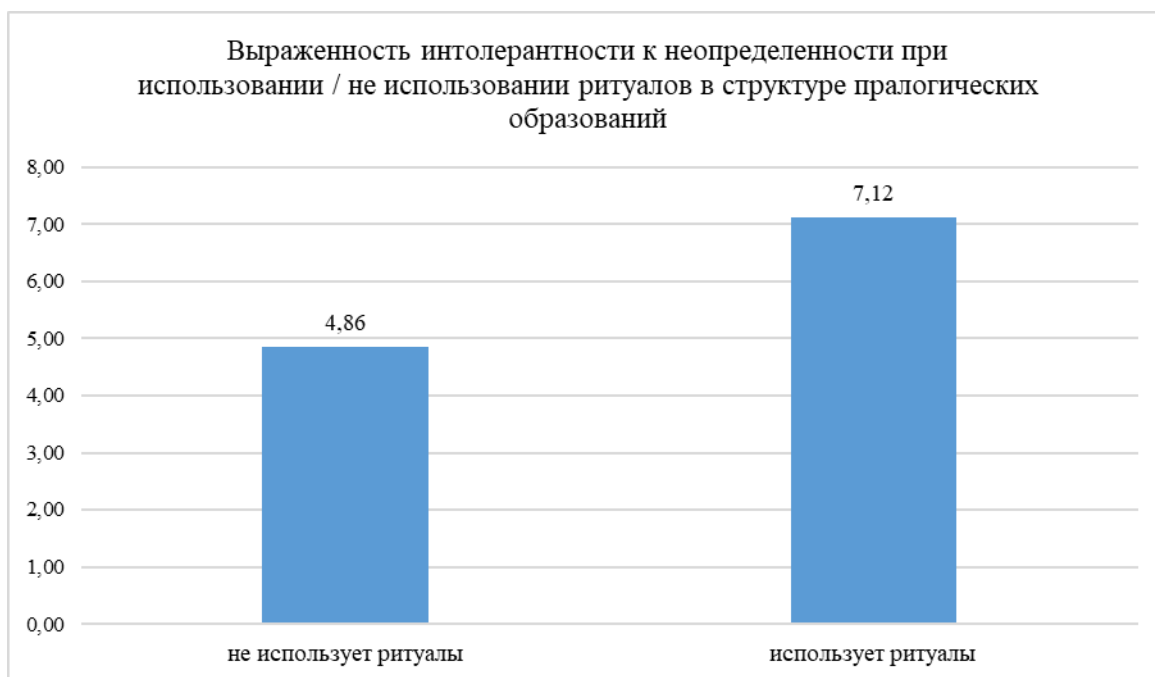
Рис. 3. Однофакторный дисперсионный анализ. Интолерантность к неопределенности и использование ритуалов. Различия статистически достоверны ( F=6,99 при p=0,02 ).

используются пралогические способы для снятия тревоги и напряжения как инструмент «магического» управления субъективно неуправляемой ситуацией.