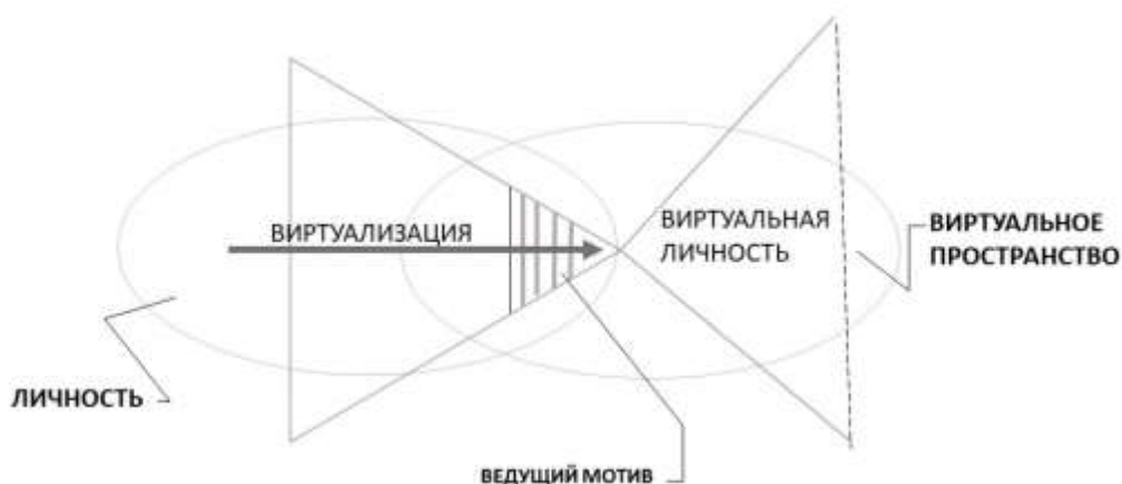
Рис. 1. Концептуальная модель реализации мотивационного механизма в процессе формирования виртуальной личности интернет-пользователя

Анализ исследований позволяет обозначить шесть групп мотивов, носящих универсальный характер: фрустрационные, защитные, социально-актуализационные, потребительские, позиционные [1, 2, 11, 12, 15, 18, 24, 25, 28–30]. В психологических исследованиях предпринимались попытки рассмотрения мотивационной составляющей виртуальной активности, которые представлены следующим: 1) мотив заполнения пустоты, 2) скука, 3) бытовая необходимость, 4) уход от проблем, 5) воспитание детей, 6) общение, 7) рабочие и профессиональные мотивы, 8) социальная поддержка, 9) деятельность по интересам, 10) хобби, 11) следование моде, 12) релаксация и отдых, 13) суеверные мотивы и 14) мотивы избегания неприятностей, 15) получение информации, 16) приобщение к важным людям и событиям, 17) влияние на события, 18) аддиктивные мотивы (мотивы зависимости), 19) личностные мотивы, 20) изменение или отреагирование эмоций, 21) самоутверждение, 22) мотивы власти, влияния [18, 24, 25, 28–30].