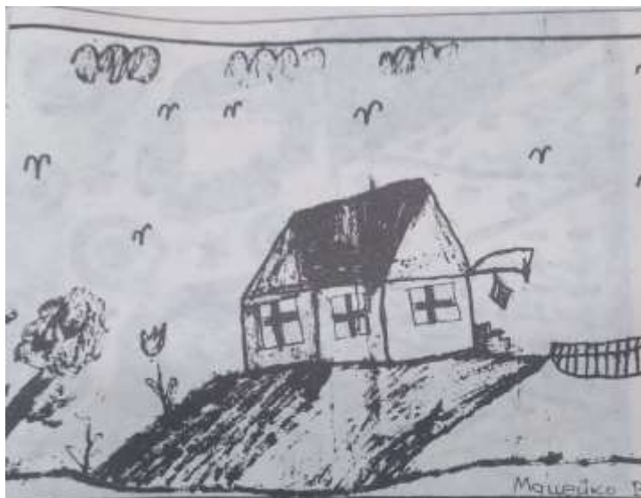
Рис. 5. Рисунок на тему: «Воспоминания о доме» мальчика В2.

Итак, из анализа представленных рисунков можно сделать вывод о том, что на неречевом этапе осознания мира, в младенческом и раннем детском возрасте, знакомство ребенка с миром происходит в форме элементарных сенсорных ощущений различных модальностей и закладывается в его базовом мировосприятии как когнитивный компонент, который формирует рефлексивный уровень осознания мира, и эмоциональный компонент осознания окружающей среды. В ситуации недостаточности или отсутствия ощущений, связанных с безопасностью, комфортом, обусловленных присутствием близкого взрослого (ситуация социального сиротства), у ребенка возникает ощущение неопределенности, переживание психического напряжения, что приводит к развитию повышенной стрессовой активности. Повышенная стрессовая активность искажает мировосприятие и способствует развитию у ребенка базового недоверия к миру, нарушается формирование индивидуального психологического времени личности и затрудняется развитие эмоциональной сферы в форме амбивалентности эмоций.