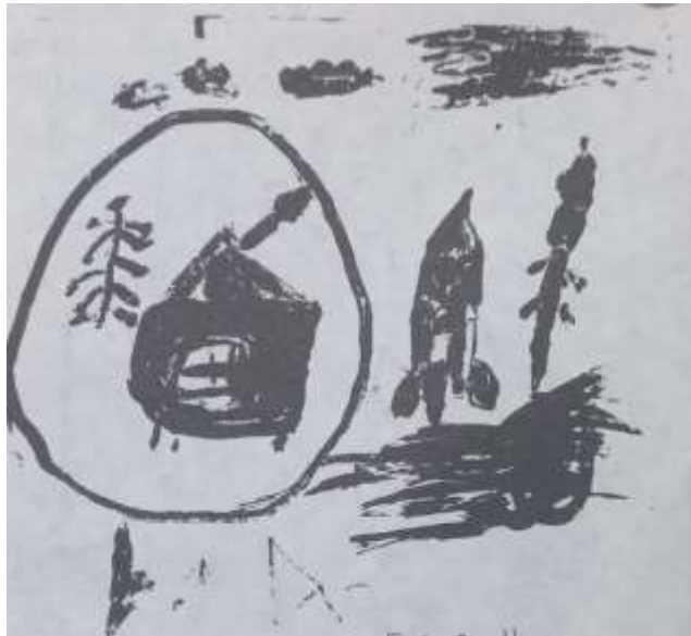
Рис. 3. Рисунок на тему: «Воспоминания о доме» девочки Н1.

космических ракет, изобразила его в крайне непрезентабельном виде (маленьким, в одно окошко, полуразвалившимся), обвела его территорию сплошной линией изоляции (рис. 3).