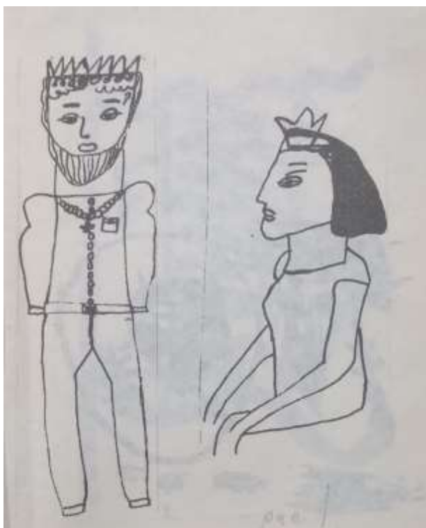
Рис. 1. Рисунок на тему: «Воспоминания о доме» мальчика В.

В качестве примера представлен рисунок 1 мальчика В. 10 лет, в школе не обучался, т. к. родители-наркоманы им не занимались, ребенок был найден в заброшенном помещении. После 3-х месяцев предварительной подготовки приступил к школьному обучению по специальной программе, за 1 год освоил программу начальной школы и был переведен в 5 класс общеобразовательной школы. По просьбе психолога нарисовал свою семью, дом в связи с его отсутствием рисовать не стал (рис. 1).