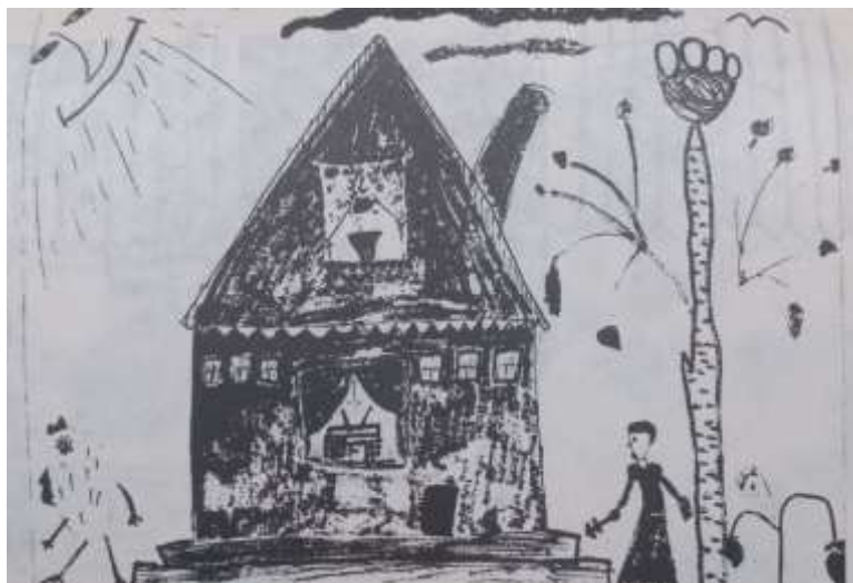
Рис. 4. Рисунок на тему: «Воспоминания о доме» девочки Н2.

Следующий рисунок дома принадлежит мальчику В2, 10 лет (рис. 5). Мальчик В2 с сестрой-близнецом воспитывались дедушкой (отец матери), отец детей неизвестен, мать лишена родительских прав, с семьей не проживала. Около полугода назад дедушка скоропостижно умирает, и дети попадают в детский дом, приезжает мать, но в родительских правах не восстанавливается и вместе с сожителем поселяется в дедушкиной квартире. Детям было разрешено посещать мать, но она контактов с детьми не поддерживала и даже уклонялась от них, сожитель матери в грубой форме просто не пускал детей в квартиру. В. изобразил на фоне тревожного неба (множество птиц, облака) приятный, приветливый домик, примостившийся на обрыве, на крыльце под навесом прикреплен яркий светильник, к краю обрыва едва прикреплен мостик, висящий над обрывом. Рисунок выражает боль утраты своего места, воспоминания о защите и тепле дедушкиного дома (фонарь на крыльце) остались в прошлом (левая половина листа), настоящее зыбко и неопределенно (мост в будущее очень ненадежен, не закреплен в настоящем), рождает ощущение опасности и само будущее (правая половина листа), оно неопределенно, даже возникает ощущение его отсутствия. Переживание неопределенности и опасности вызвало у детей активизацию стрессовых реакций, и с ними был проведен цикл антистрессовой терапии.