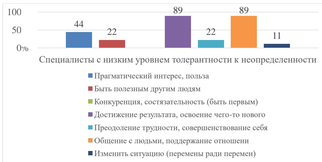
Рис. 1. Оценка смысла в социальном взаимодействии респондентами с низким уровнем толерантности к неопределенности (%)

Также по мере роста уровня толерантности к неопределенности (от низкого к среднему) специалисты более высоко оценивают взаимосвязь и взаимовлияние разных сфер общения и жизнедеятельности, в большей степени выстраивают взаимодействие с людьми с учетом их отношения к себе, не отступают от своих принципов, даже если им приходится трудно, чаще следуют принципам в социальном взаимодействии.