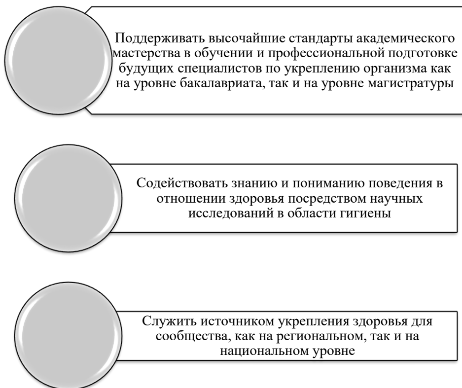
Рис. 2. Миссия организации санитарного просвещения

осуществлять санитарное просвещение студентов, формировать компетенции будущих педагогов в области гигиенического образования. Подготовка будущих учителей является важным фактором успеха школьной программы санитарного просвещения. Учителей нужно ознакомить с концепцией укрепления организма обучающихся и формирования у них здорового и безопасного образа жизни. Все учителя должны пройти обучение и получить точную информацию, чтобы эффективно решать вопросы гигиены в предметной области. Сегодня вновь возвращается в программу педагогических вузов данная предметная область, миссию которой можно представить следующим образом (рисунок 2) [8].